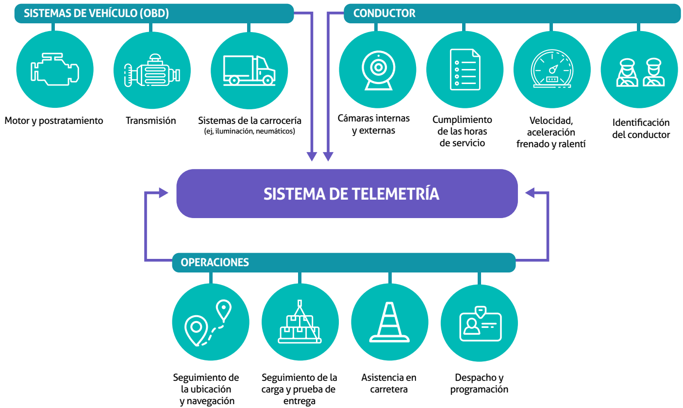
Figura 4. Los tres tipos de datos recogidos o generados por los sistemas de telemetría

Existen variadas empresas de telemática y nuevos proveedores atraídos por el mercado de los camiones, hay una gran variedad de productos y servicios disponibles para las flotas. Según un estudio realizado por el Consejo Internacional de Transporte Limpio (ICCT, por sus siglas en inglés) [9] se distinguen los siguientes típicos datos de los sistemas de telemetría.