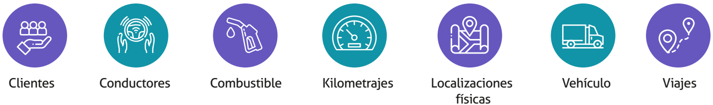
Figura 1. Ejemplo de requerimientos de información para un registro de datos

Adicionalmente las empresas pueden desarrollar y administrar planillas checklist con información que deseen recopilar por cada viaje, como la que se muestra a continuación.