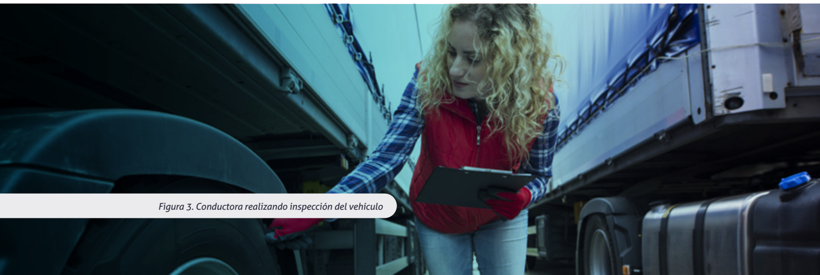
Figura 3. Conductora realizando inspección del vehículo